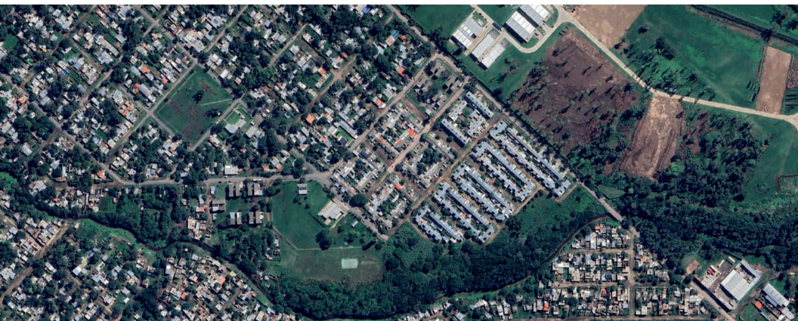
Figura 2. Esquema de desarrollo de nuevas herramientas moleculares para la detección de virus en aguas de diferentes ambientes mediante metagenómica seguida de validación de reacciones moleculares específicas. Adaptado de (Bibby et al., 2019).

El barrio presenta una notable diversidad proyectual en cuanto a las viviendas. A partir del relevamiento realizado, se identificaron cuatro tipologías principales de vivienda, diferenciadas por su morfología, altura y configuración espacial. Estas tipologías incluyen: viviendas unifamiliares en planta baja, bloques con planta baja y dos niveles superiores con acceso compartido, tiras de viviendas con accesos individuales en tres niveles, y bloques dispuestos en forma de "L" con un piso superior.